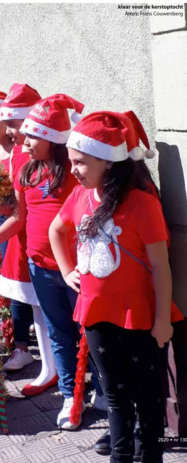
klaar voor de kerstoptocht

Op de scholen worden we allerhartelijkst ontvangen. Men is volop bezig met de afsluiting van het schooljaar en de voorbereidingen van het naderende kerstfeest. Steeds vindt men wel ruimte om ons te laten zien wat er al gedaan is met de opgedane kennis tijdens het werkbezoek in oktober aan Tilburg. Er worden workshops 'gipsmaskers maken' gegeven en de gymlessen die we zagen bevatten talrijke suggesties die in Tilburg aan onze gasten werden voorgelegd. Op de pabo in Matagalpa worden op basis van het geleerde in Tilburg, aanpassingen in het lesprogramma 'rekenen' voor het komende schooljaar doorgevoerd. Kortom, overal zagen we dat het een prima idee was om de groep van zeven docenten uit Matagalpa voor een stage van twee weken in Tilburg uit te nodigen.