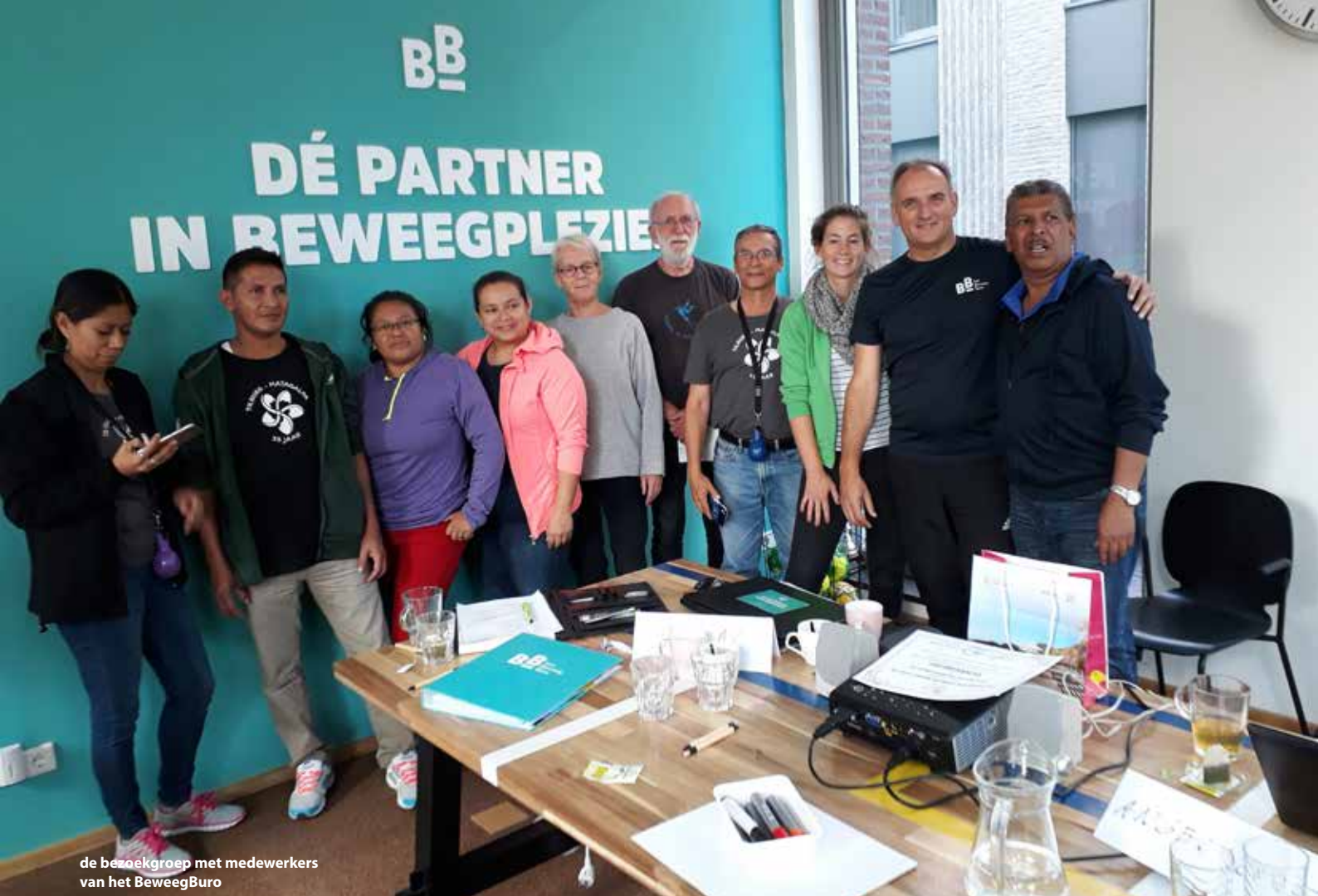
de bezoekgroep met medewerkers van het BeweegBuro