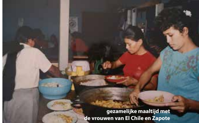
gezamenlijke maaltijd met de vrouwen van El Chile en Zapote