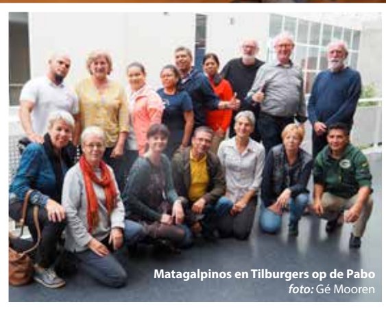
Matagalpinos en Tilburgers op de Pabo