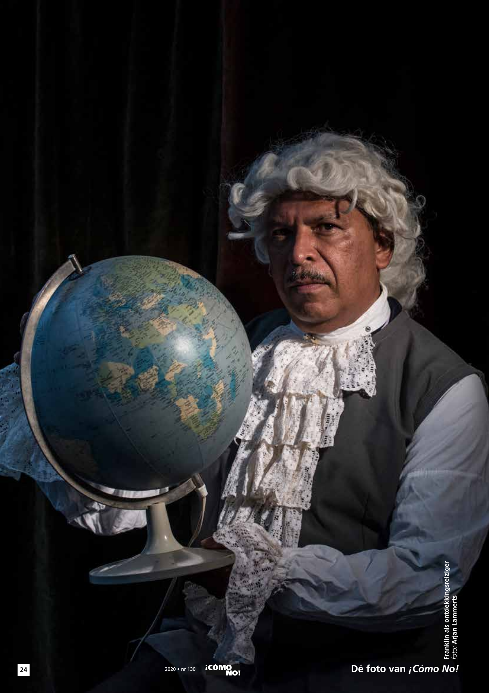
Franklin als ontdekkingsreiziger