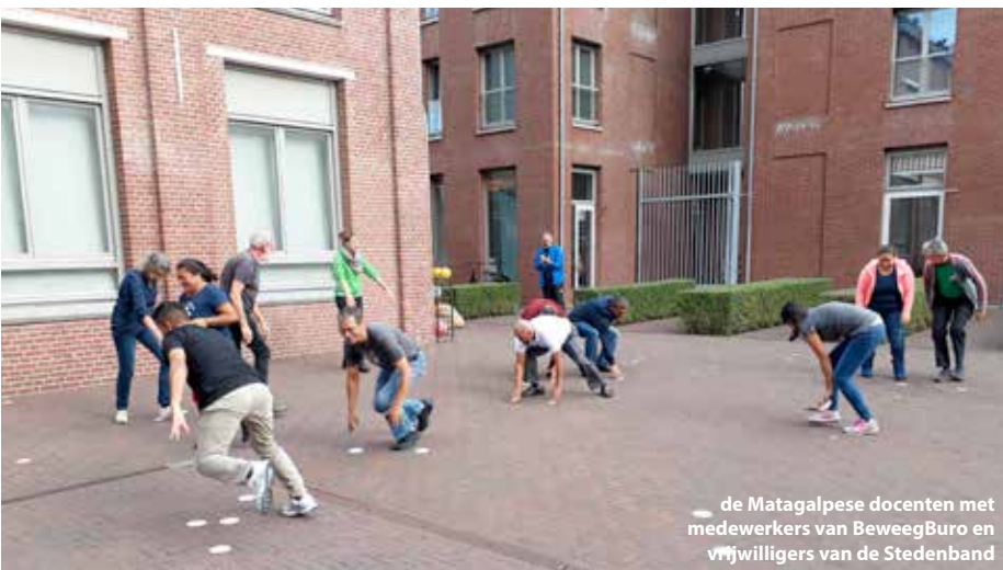
de Matagalpese docenten met medewerkers van BeweegBuro en vrijwilligers van de Stedenband