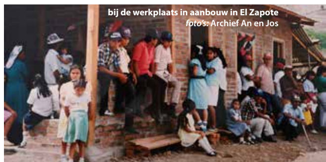
bij de werkplaats in aanbouw in El Zapote

is, dat alle mannen uit het dorp de speciale gast te paard op gaan halen, op een afgesproken plek. Dan komen ze aanstormen, het dorp in, Alemán voorop, met veel gejoel en gejuich, rode partijvlaggen (dat heeft hier niets met communisme of sandinisme te maken). Alemán lijkt een echte campesino , zo te paard en dat maakt indruk. Men zegt dat het een gewone partijbijeenkomst was, maar er gaan ook geruchten dat de mensen van de extreem-rechtse Partido Liberal de ex-contra's aan het mobiliseren zijn. Jos was al helemaal ongerust toen we terugkwamen want de bijeenkomst had de nationale pers gehaald. Daarin leek het dat de ex-contra's het stadje Matiguás bezet hadden.