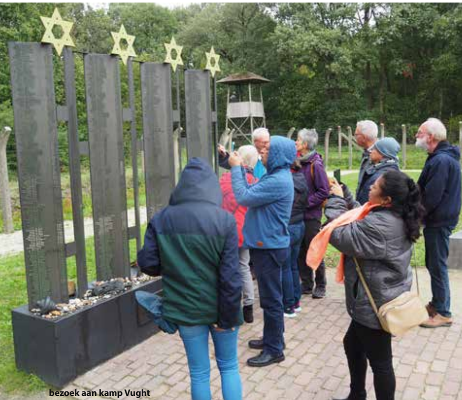
bezoek aan kamp Vught