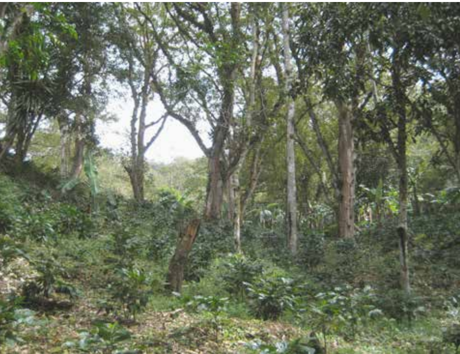
koffiestruiken als onderdeel van het ecosysteem

De organisatie FUMDEC heeft wel een en ander gemerkt van de politieke crisis en van de coronacrisis. Omdat diverse vrouwen failliet gingen, een paar vrouwen overleden en anderen naar het buitenland vertrokken, liepen de verliezen op. Gelukkig vond men wel twee nieuwe financiers: SICSA, een organisatie actief in Midden-Amerika, en WCCN, een Amerikaans fonds. Het Landelijk Beraad Stedenbanden Nederland-Nicaragua (LBSNN), dat FUMDEC een lening verschaft uit het Rotatiefonds, was onlangs op werkbezoek in Nicaragua. 'FUMDEC meldt voorzichtig herstel van de kredietportefeuille, maar de doelgroep blijft het zwaar hebben, mede vanwege Covid. Met de microkredieten van FUMDEC kunnen (alleenstaande) vrouwen hun kinderen naar school sturen en stap voor stap hun levensomstandigheden verbeteren. Al blijven de gehanteerde rentetarieven relatief nog hoog vanwege de risico's, de overhead is al fors gereduceerd. De organisatie blijft waardevol om overeind te houden; veel grotere microkredietinstellingen staan al te ver af van deze doelgroep', aldus Ronald van der Hijden (LBSNN) op Twitter.