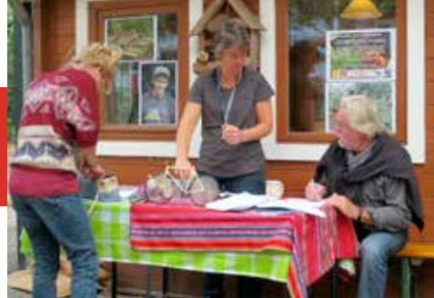
de start van de Vuelta in 2014

Een Nicaraguaanse muurschilder maakt samen met studenten van Yuverta een meterslange mural op het gebouw langs het spoor. Yuverta zijn drie groene scholen, het Wellantcollege, Citaverde en Helicon, die samen verdergaan onder deze naam Yuverta.