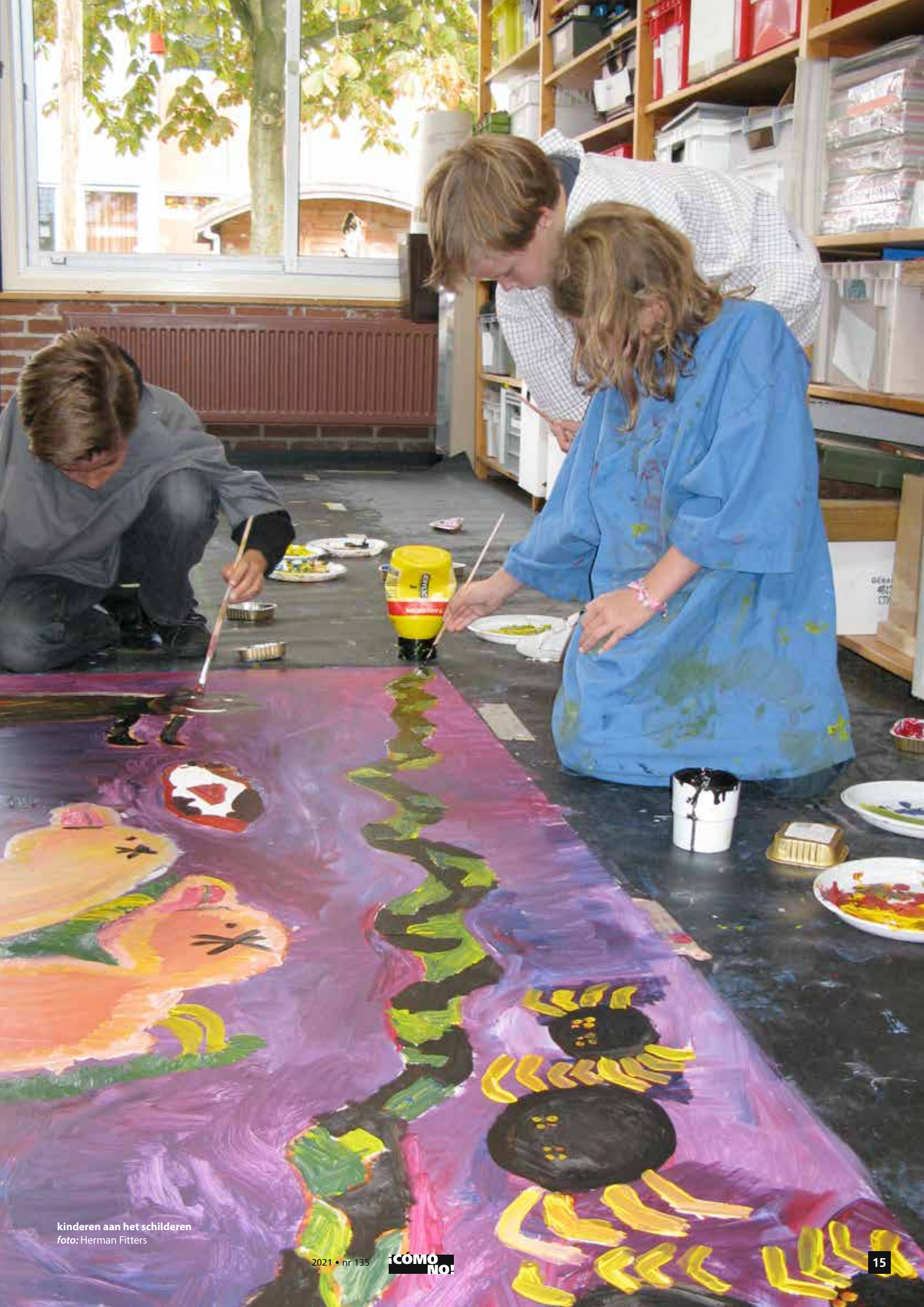
kinderen aan het schilderen