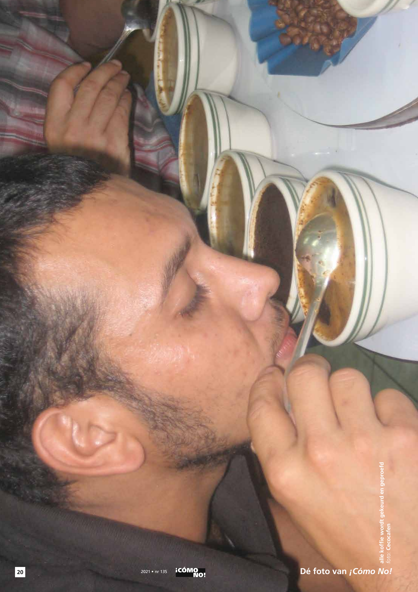
alle koffie wordt gekeurd en geproefd