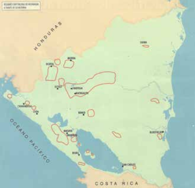
koffiegebieden in Nicaragua