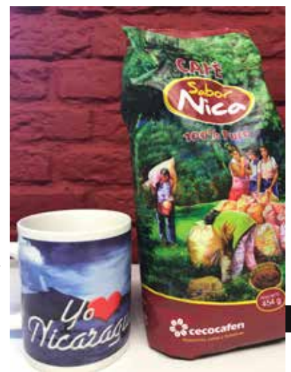
koffie van Cecocafen, nog niet in de nieuwe verpakking