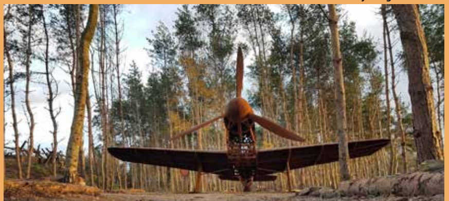
schijnvliegveld De Kiek