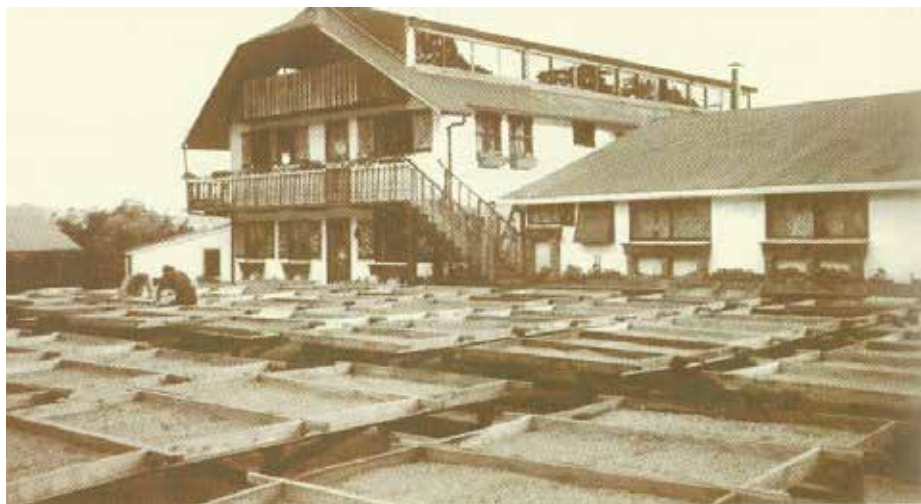
landgoed Selva Negra van de familie Kühl in Matagalpa

samengevat en vertaald door Miranda van der Klaauw