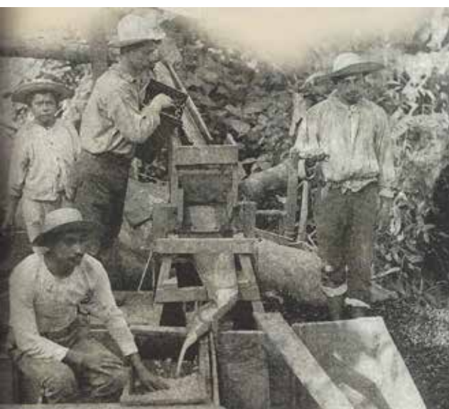
de nieuwe ontpulpmachine uit 1891 door Otto Kühl