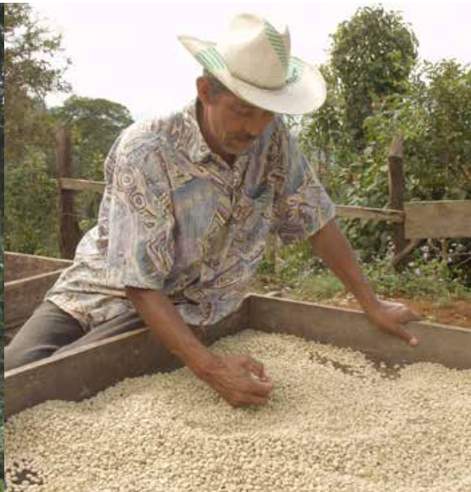
boer sorteert bonen

Na aan kleine donatie aan het begin van de coronapandemie, stelden we nogmaals 2000 euro beschikbaar aan het Comité Mano Vuelta. Men wilde de partnerscholen opnieuw in staat stellen om hygiënemaatregelen te treffen en had het plan opgevat om samen mondkapjes te naaien voor alle docenten. In Nicaragua was onlangs pas sprake van de 'tweede golf' en zijn tot nu toe alleen ouderen met een chronische ziekte gevaccineerd. Preventie blijft daarom extra belangrijk.