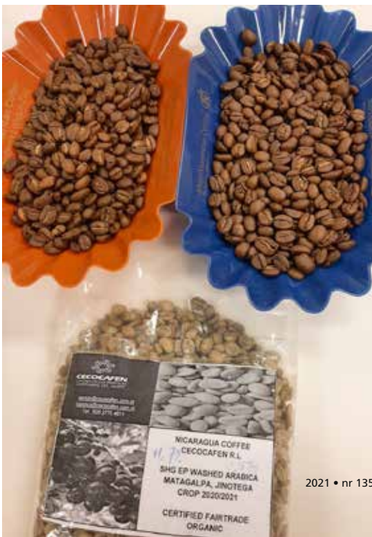
koffie van Cecocafen uit Matagalpa