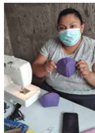
mondkapjes naaien in Matagalpa