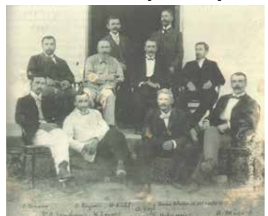
Duitse migranten in Nicaragua in 1898