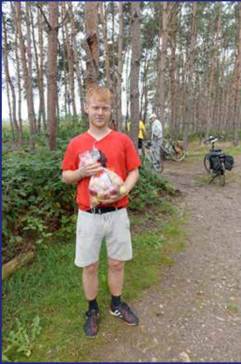
een appeltje voor de dorstige fietsers die passeren