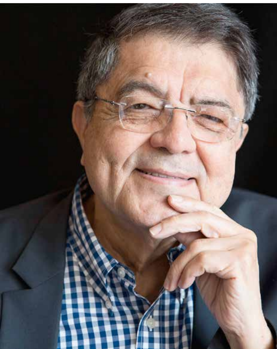
Sergio Ramírez

Ramírez heeft een breed scala aan literaire werken gepubliceerd, waaronder romans, korte verhalen, essays en bloemlezingen. Zijn publicaties zijn vertaald in achttien talen, zoals Russisch, Hebreeuws en Duits. Onder de titels van zijn geschriften zijn Goddelijke Straf ; Margarita, de zee is prachtig ; Een gemaskerd bal ; allemaal internationaal bekroonde werken.