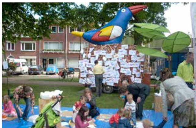
kinderen en ouders bij het nest vol wensen

Bij het woord community denken we tegenwoordig vooral aan een online wereld. Maar waarom deze niet koppelen aan een fysieke plek? Een plek op een leuke locatie in de stad, van waaruit we koffie, boeken en reizen kunnen verkopen, activiteiten kunnen organiseren en stages kunnen aanbieden. Wij zien het al helemaal voor ons ... doe je mee?