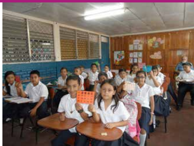
klasje in Matagalpa

* Vanuit de Stedenband werd elke twee jaar in de meivakantie een onderwijswerkbezoek naar Matagalpa georganiseerd. De laatste keer was in 2017. In 2019 was de situatie in Nicaragua onveilig, maar lukte het wel om een onderwijswerkbezoek in Tilburg te organiseren. Vanaf 2020 hebben we te maken met de coronapandemie.