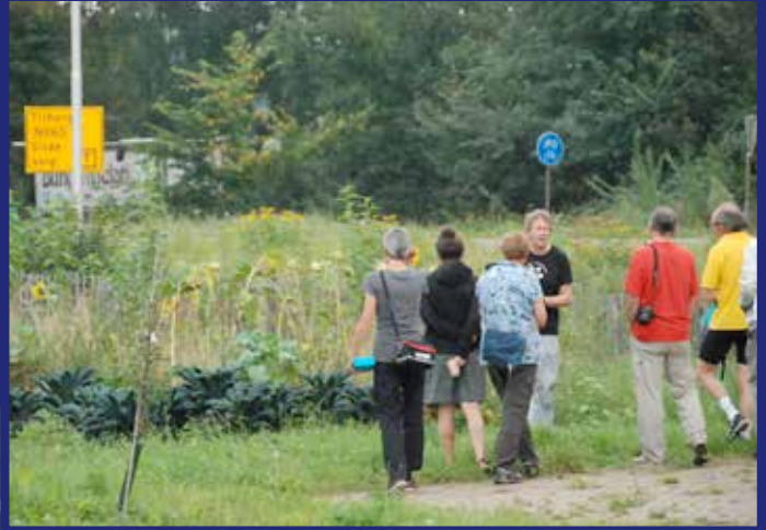
rondleiding op de coöperatie waar op duurzame wijze voedsel wordt geproduceerd