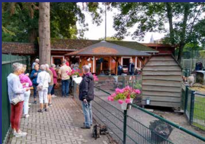
drukke bij de start van de fietstocht bij Kinderboerderij Kerkibo in de Bisschop Bekkerslaan