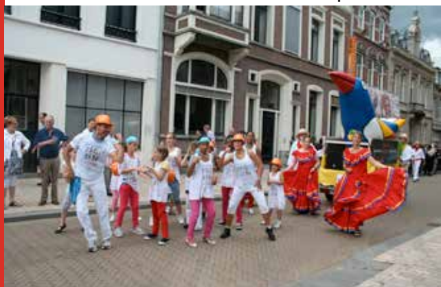
Stedenband in de carnavalsoptocht

miranda@tilburg-matagalpa.nl of 06-1303 6091