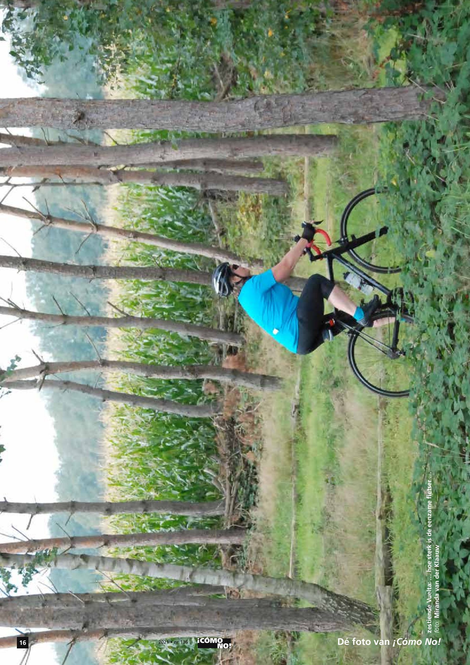
zestiende Vuelta: ... hoe sterk is de eenzame fietser ...