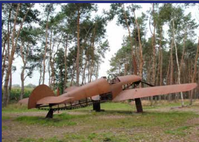
bij het eerste verrassende afstappunt, het schijnvliegveld De Kiek in de buurt van Alphen