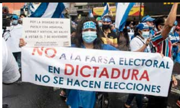
'nee tegen de verkiezingsfarsce'

Allereerst heeft Daniel Ortega binnen zijn partij -het FSLN- een lange staat van dienst. Tijdens de dictatuur van Somoza heeft hij als guerrillastrijder van het FSLN in de gevangenis gezeten, hij was politiek -zeker in de begintijd- goed geschoold. Door zijn charisma heeft hij in de loop der jaren een tot de verbeelding sprekende naam opgebouwd. Het was niet meer dan logisch dat hij in 2007 verkozen werd, het project van het FSLN stond toen nog steeds als een huis: opkomen voor de kansarmen, beter onderwijs, goede gezondheidszorg, werkgelegenheid.