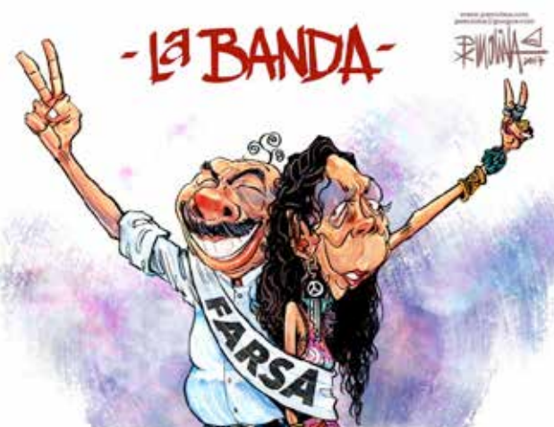
cartoon van Pedro Molina in Confidencial