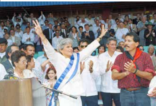
de Nicaraguaanse president Violeta Barrios de Chamorro tijdens haar inauguratie in Managua in 1990