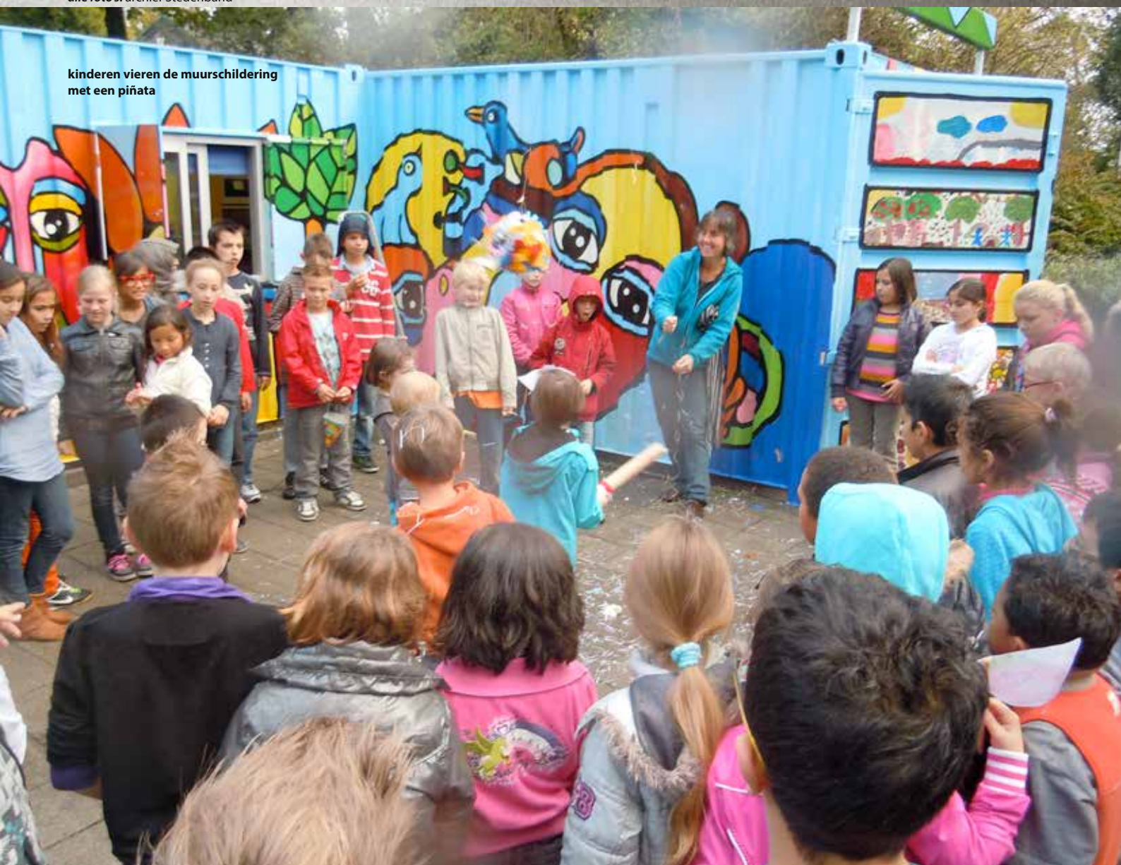
kinderen vieren de muurschildering met een piñata