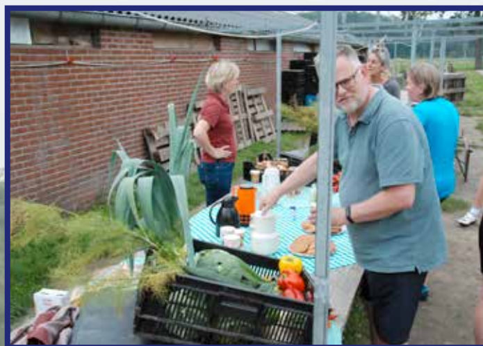
un bakske thee of koffie mee un kuukske bij De Herenboeren Goedentijd